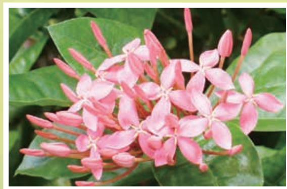
美しく咲いたグアムの花