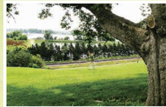
リパのサンタマリア修道院からミシシッピ川を臨む (ミズーリ州セントルイス)