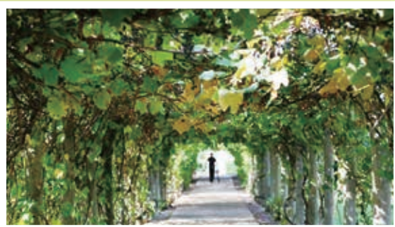
ノートルダム修道院のぶどう棚トンネル (ウィスコンシン州エルムグローブ)

ノートルダム教育修道女会は、地球共同体に深い関心を持ち、地球の全体性と聖性への敬意を自分たちの中に、また人々の間にも培うことに努めています。従って私たちノートルダム教育修道女会セントラルパシフィック管区メンバーは、以下の原則に従って生きることを決意します。私たちが委ねられている聖なる場にとどのような関わりを持つかを示唆するのもこの原則です。この原則は聖書、ノートルダム教育修道女会の会憲と一般指針（YAS）及び総会指針に根差しています。