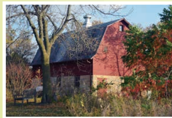
善き勤めの聖母の丘修道院に在る赤壁の納屋 (ミネソタ州マンケート)