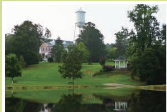
セントメリー・オブ・ザ・パインズ修道院の池 (ミシシッピ州チャタワ)

*大地の倫理とは、アルド・レオポルド (Aldo Leopold: アメリカ合衆国の著述家、生態学者、森林管理官、環境保護主義者) による造語。空気・土・水・植物・動物・人間は全て、生態系の中で、大きな共同体を形成している。著書 Sand County Almanac (『野生のうたが聞こえる』講談社 1997年) で、生態系とそこにいる人間との関係を述べるために “大地の倫理” という表現を用いた。